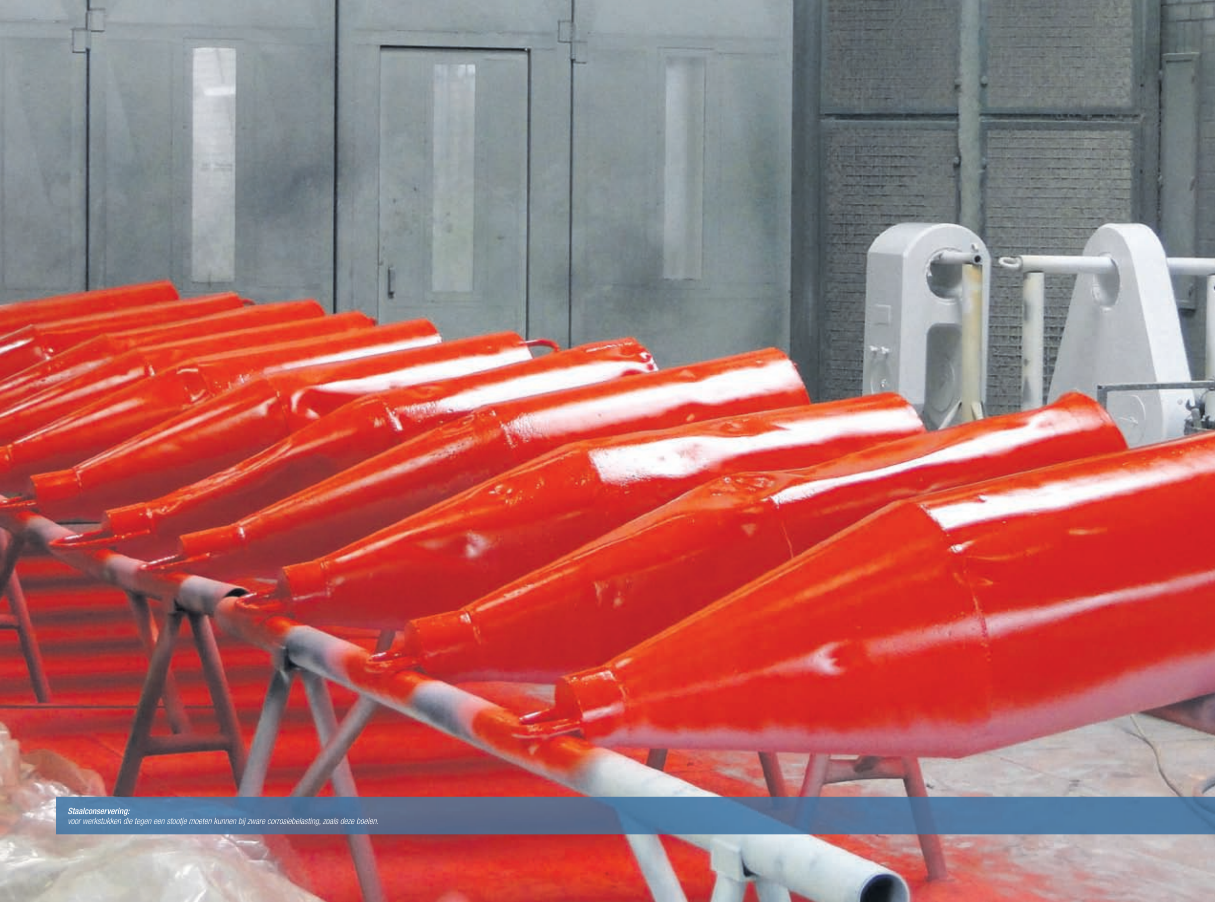
Staalconservering: voor werkstukken die tegen een stootje moeten kunnen bij zware corrosiebelasting, zoals deze boeien.