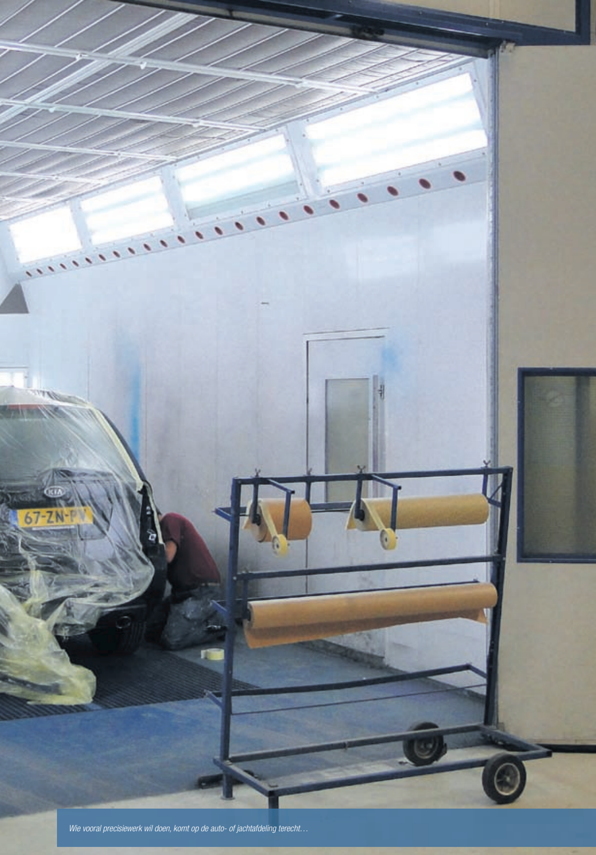
Wie vooral precisiewerk wil doen, komt op de auto- of jachtafdeling terecht...

En als je het verknoeit, is dat eenmalig want die opdrachtgever zie je nooit meer terug. Je komt er dan niet meer tussen."