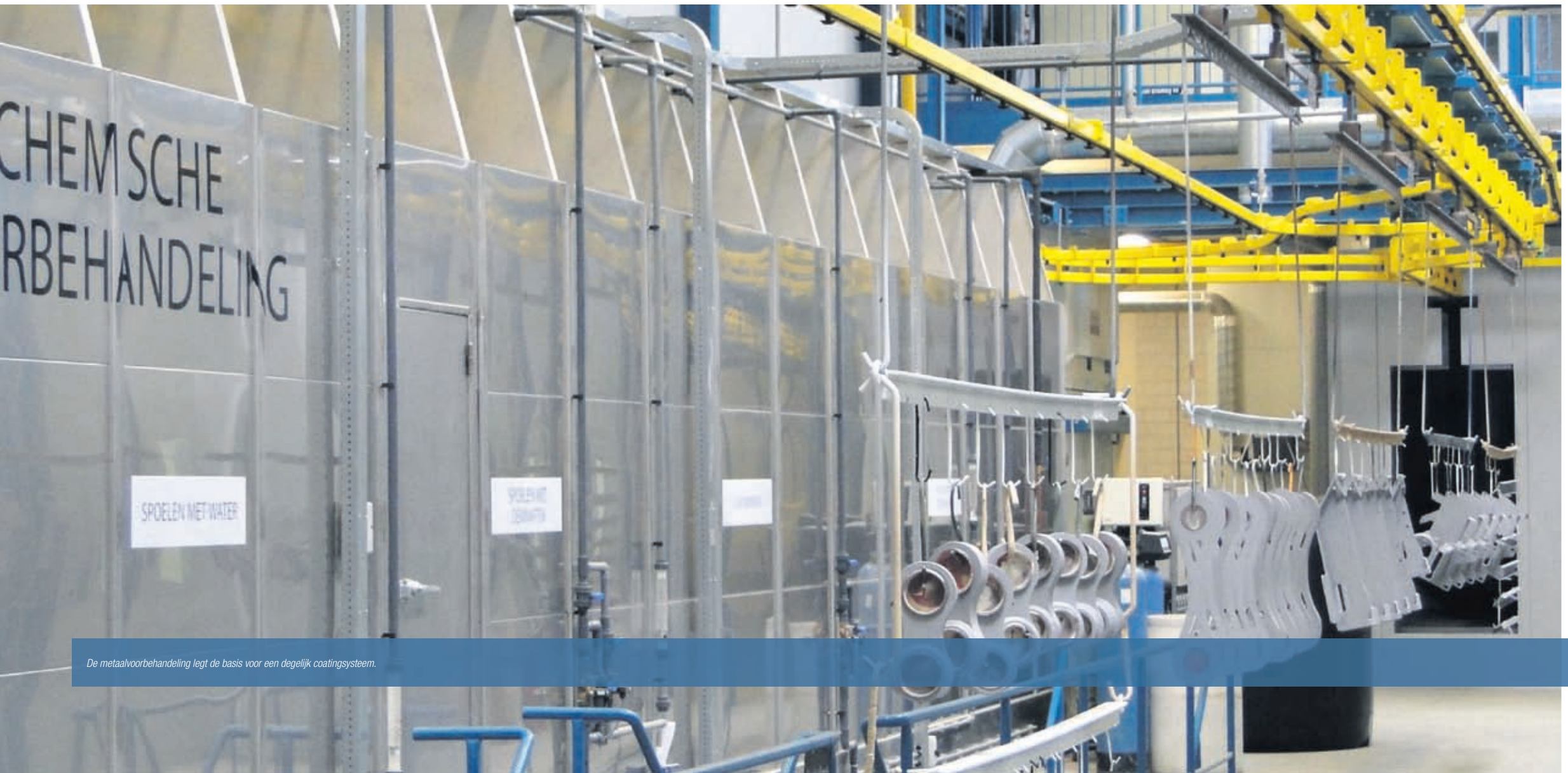
De metaalvoorbehandeling legt de basis voor een degelijk coatingsysteem.